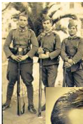
A Anton Redó el van cridar a files el juliol del 1937. Aquest és el relat que va fer el 13 de gener del 1938, des del front, en concret des del municipi aragonès de Sietamo, a la província d'Osca. Al front de l'Aragó hi va haver combats molt durs. El 7 de març del 1938 les tropes franquistes, sempre amb un gran suport aeri alemany i italià, van començar a esquarterar el front. El general sublevat Juan Yagüe va ocupar Fraga i va començar a avançar cap a les Terres de Ponent i de l'Ebre. La repressió va ser ferotge. Hi va haver càstigs, afusellaments, molta violència i també molts robatoris.